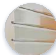
M10G auch gelocht möglich