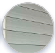
M7G 8 Standardfarben